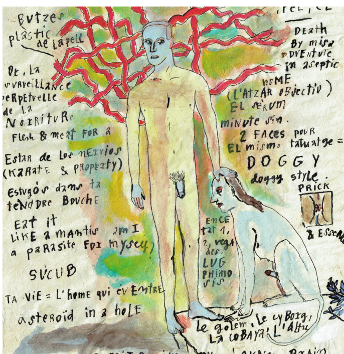
Lluís Juncosa, Crab Broth , 1988. Arxiu Lluís Juncosa

Exposició del 4 de novembre de 2016 al 19 de març de 2017