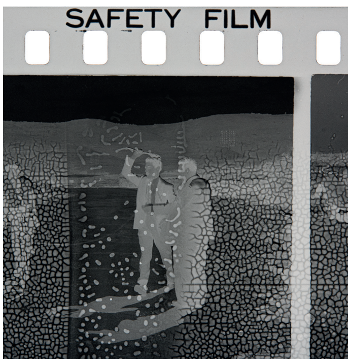
Akram Zaatari, Safety Film , 2017 (detall). Ampliació d'un negatiu de 35 mm d'Antranick Bakerdjian, Jerusalem, dècada de 1950

Exposició del 7 d'abril al 25 de setembre de 2017