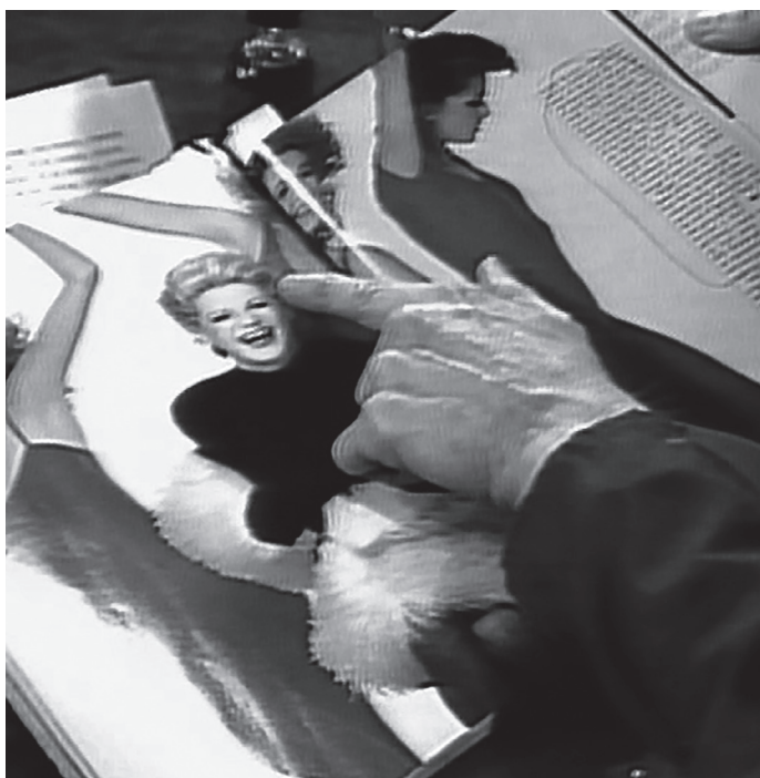
Martha Rosler Reads 'Vogue' , 1982. Video monocanal, color, so, 25 min 45 s Col·lecció MACBA. Dipòsit de l'Ajuntament de Barcelona

Exposició del 18 de maig al 15 d'octubre de 2017